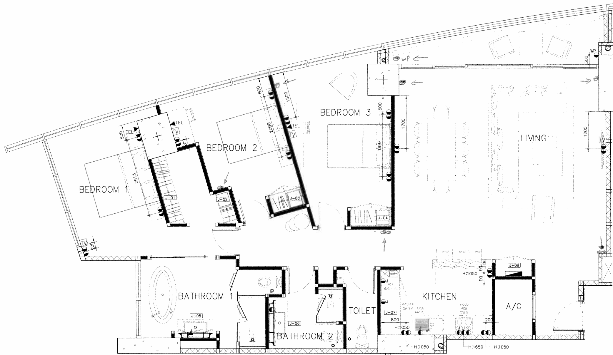
A FURNITURE & ELECTRICAL PLAN SCALE: 1:50